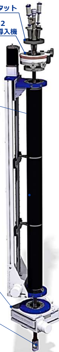
MR63DPV552 差動排気回転導入機