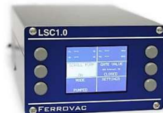
真空システム用制御ユニット