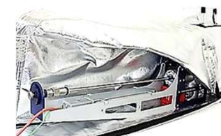
UHVスーツケース用バックアウトテント