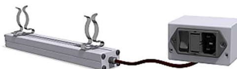
UHVスーツケース用ヒーターモジュール