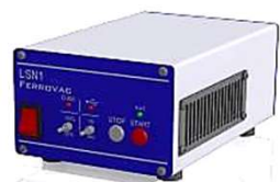
NEG起動コントローラー