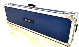
UHVスーツケース用フライトケース