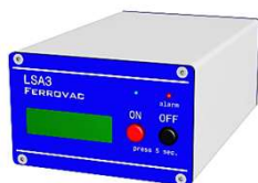
バッテリー駆動 イオンポンプコントローラーV3